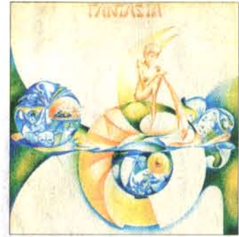
STMBB toimi 70-luvun Fantasiassa. Yhtyeen ainokainen, keräilyharvinaisuus, julkaistiin vuonna 1975.

Mutta vaikeaa piti olla, koska se tuntui hienolta. Blues taas vaatii vain pari soittoa, mutta se ei toimi ilman pitkää soittokeimusta ja itsensä likoon pistämistä.